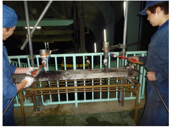
ばんび号側 えい索切詰作業（山頂駅）