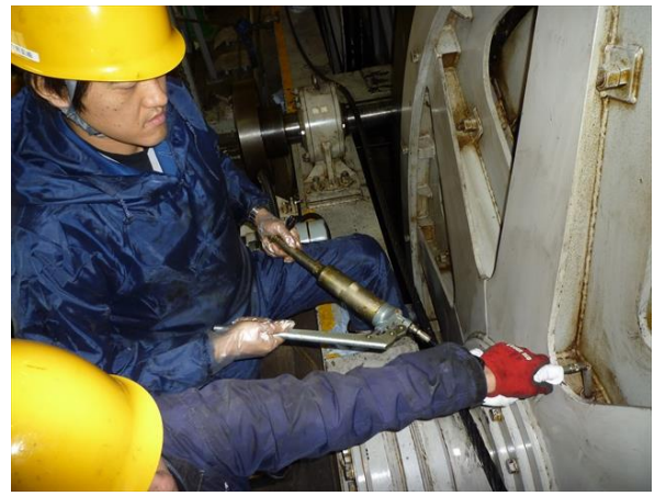
原動滑車の点検整備