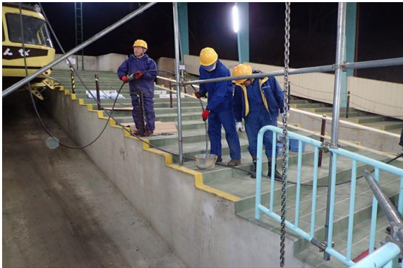
ばんび号側 平衡索切詰作業 (山麓駅)