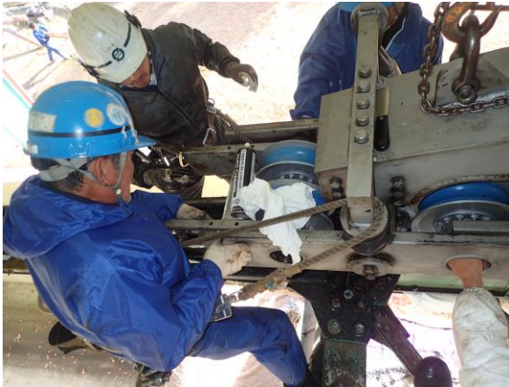
キャリアランナーの交換