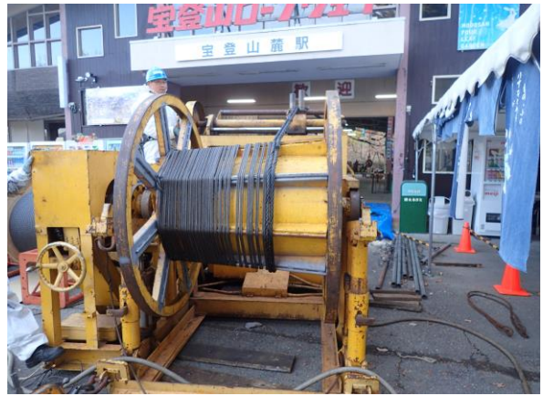
曳索・平衡索交換工事