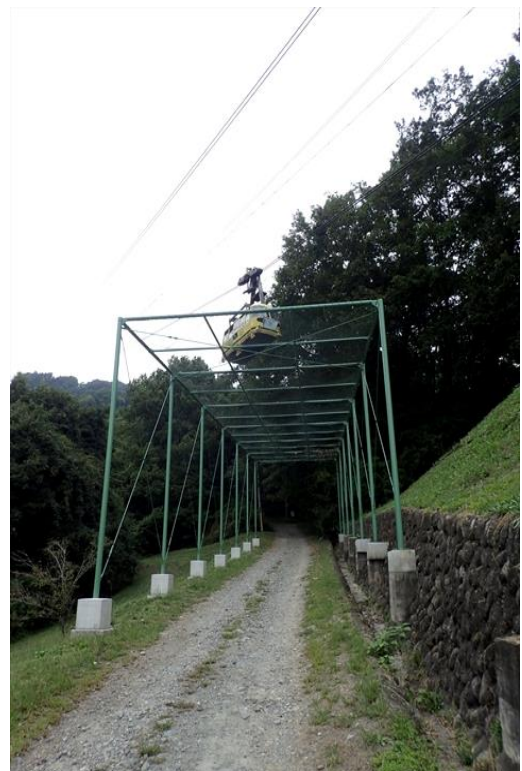
落下物防止柵の設置 (町道長瀬43号線)