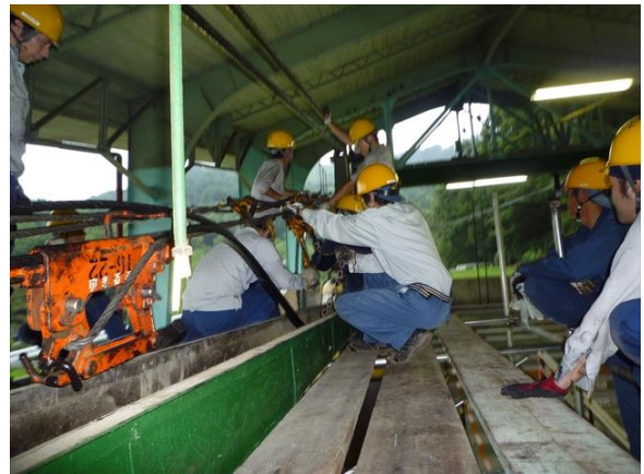
ばんび号側 平衡索切詰作業 (山麓駅)